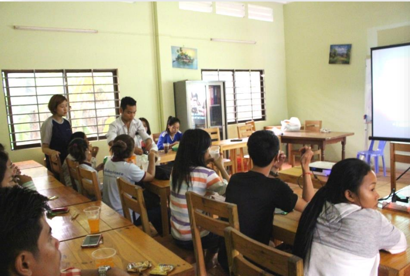
5월의 영화 정글북