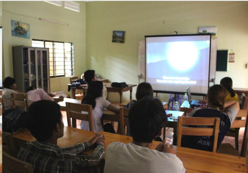
6월의 영화 주토피아