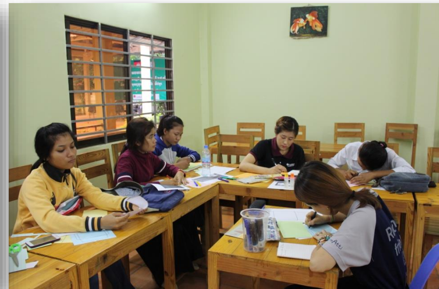
그림 그리는 것을 좋아하는 유스들