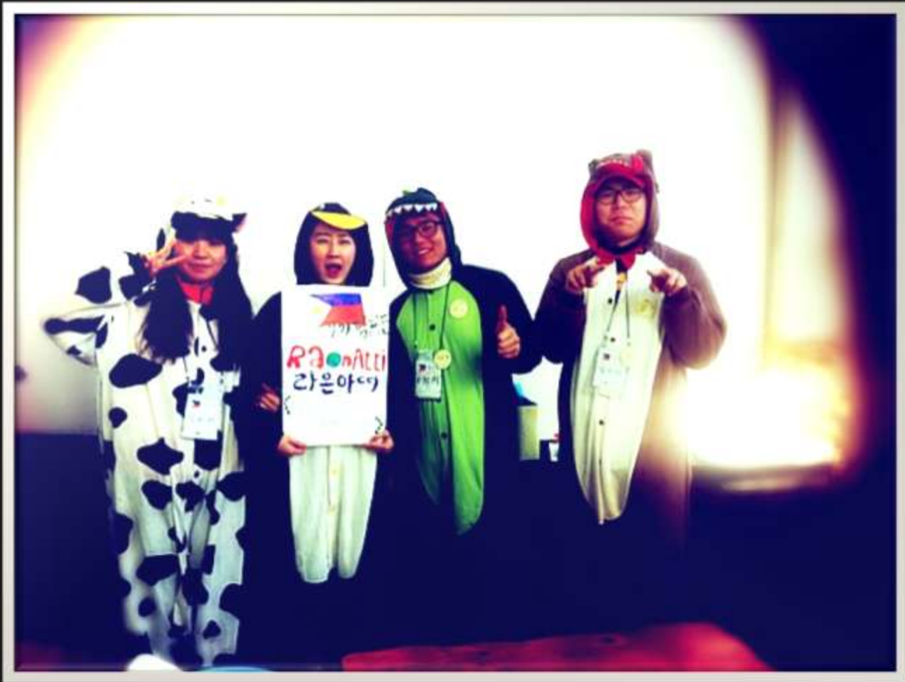
“세계가 100명의 마을이라면”