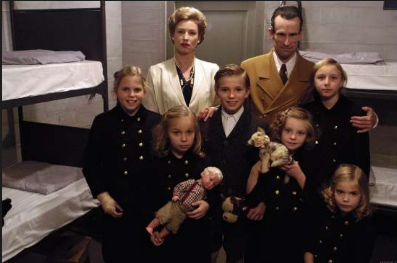
“히틀러와 제 3 제국의 종말”