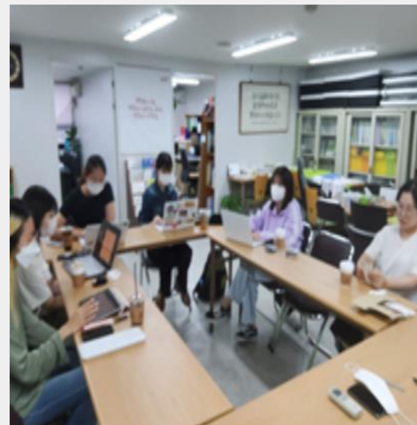
8.30 고양 YMCA 방문 및 피드백 사진