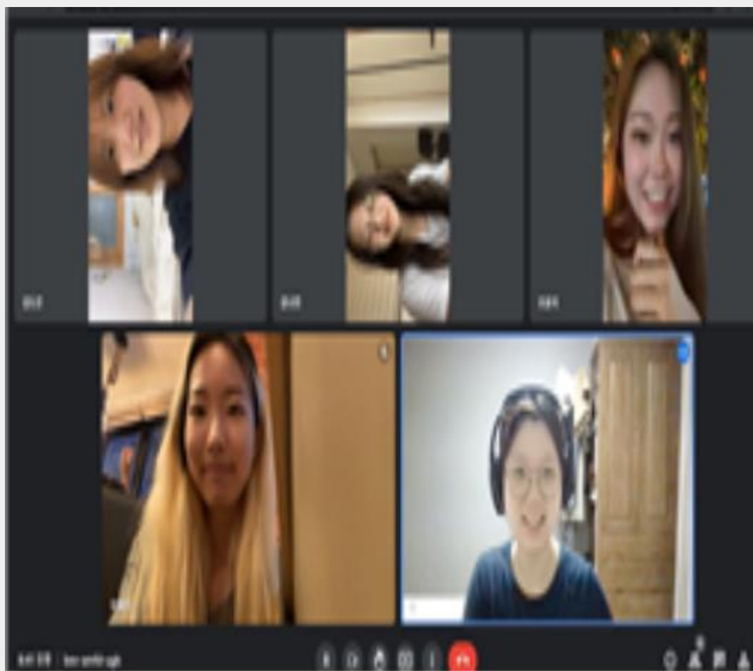
8.25 비대면 회의