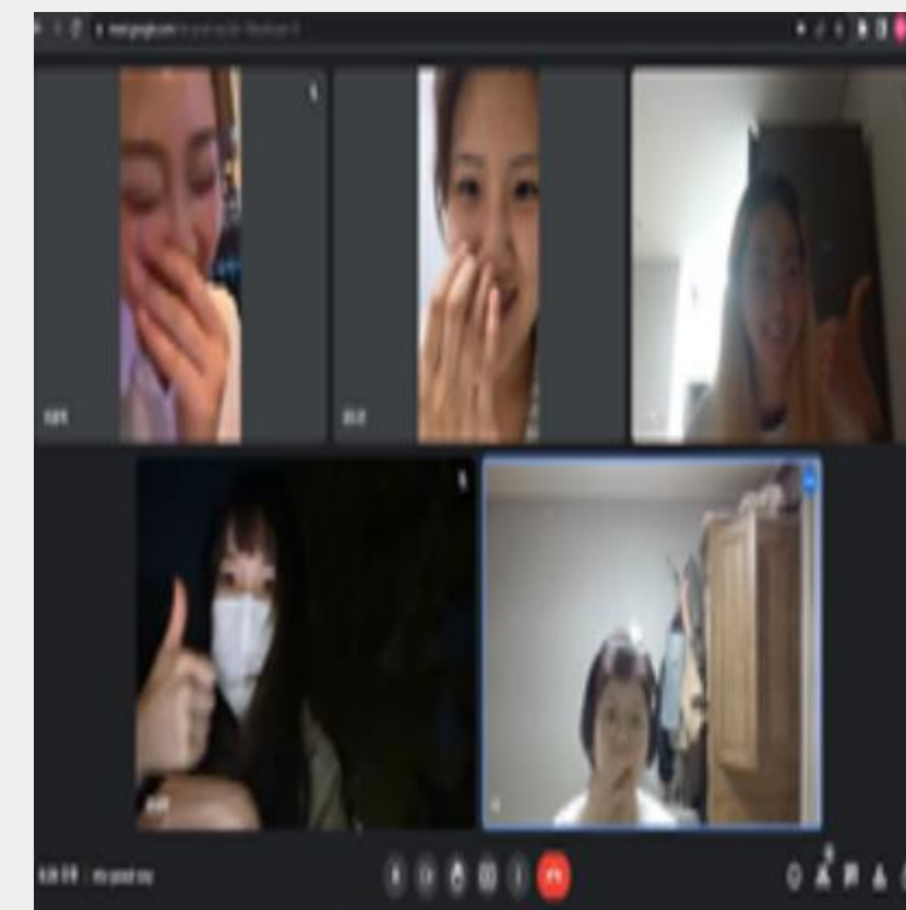
8.27 비대면 회의 사진