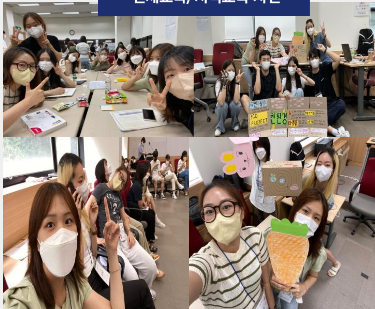
전체교육, 지역교육 사진