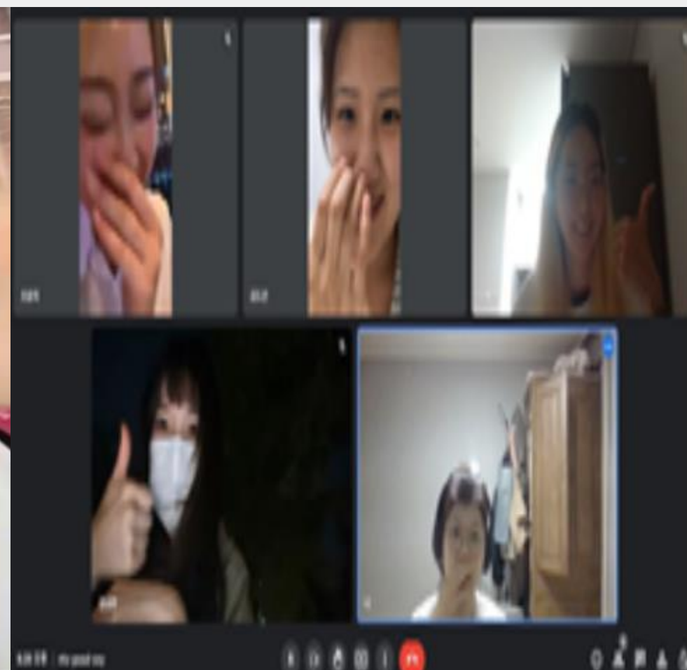
8.27 비대면 회의