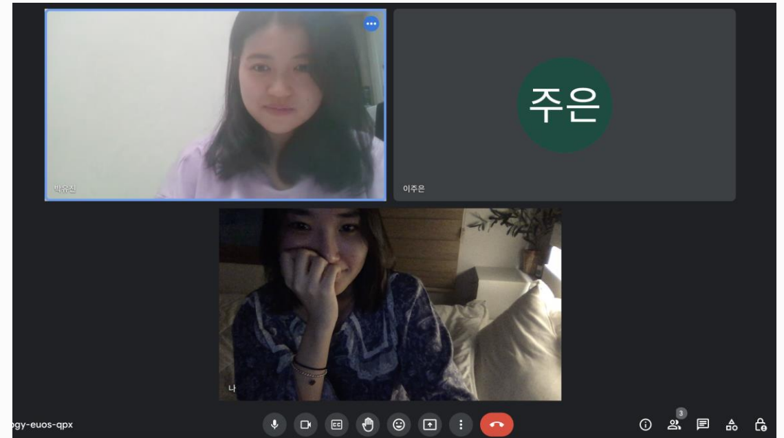
온라인 회의 진행

지속가능한 발전에 대해 평소에 많이 들어봤지만, 내가 직접 나서서 프로젝트를 진행하고 발로 뛰기도 하며 정말 보람있는 활동이었다. 좋은 단체에서 좋은취지의 활동을 하게 되어 정말 뿌듯하다. 다음에도 좋은 기회가 있다면 반드시 참여하고 싶다.