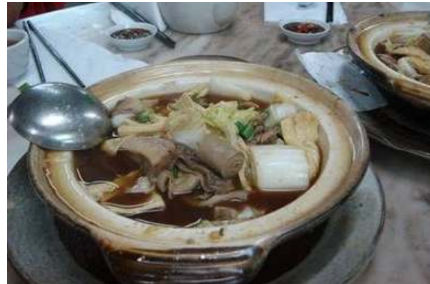
함께 먹은 바큐테-말레이시아 갈비찜