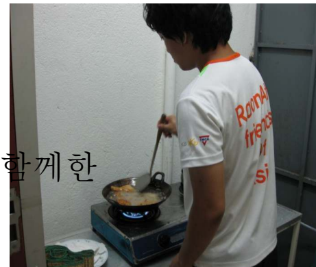
남남 저녁 해먹기