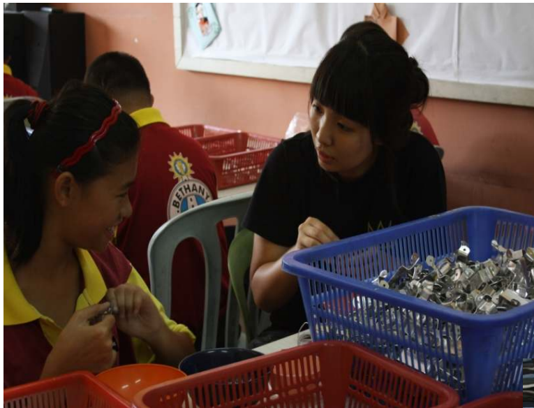
Working with Bethany Friends