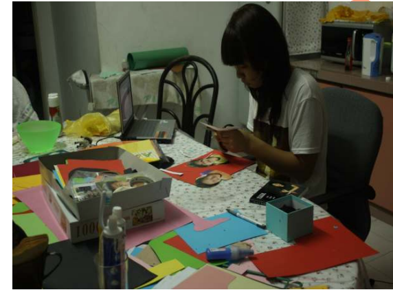
<현예지 팀원이 만든 모든 반을 위한 사진 프레임>