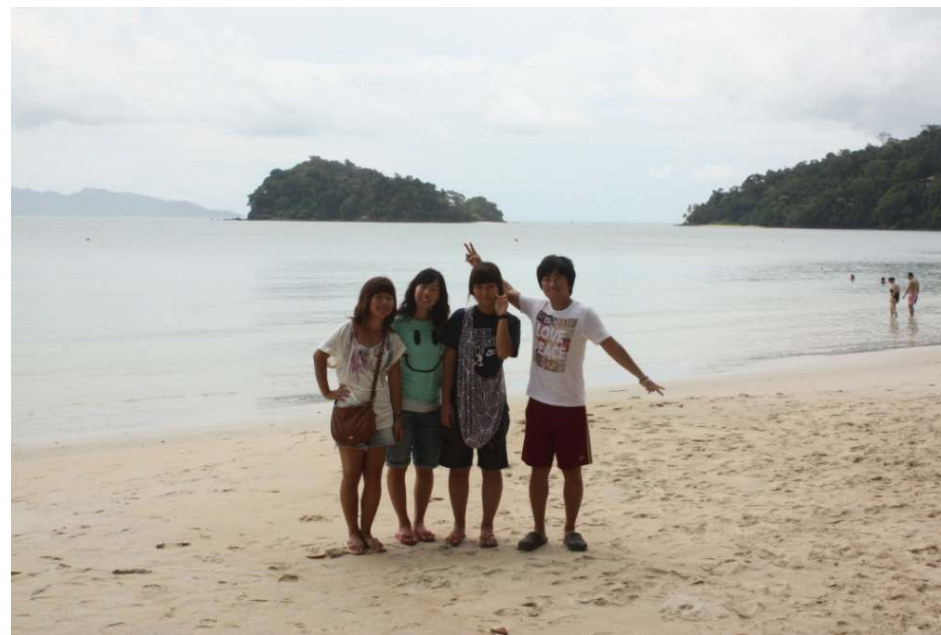
랑카위에서 맑은 주말