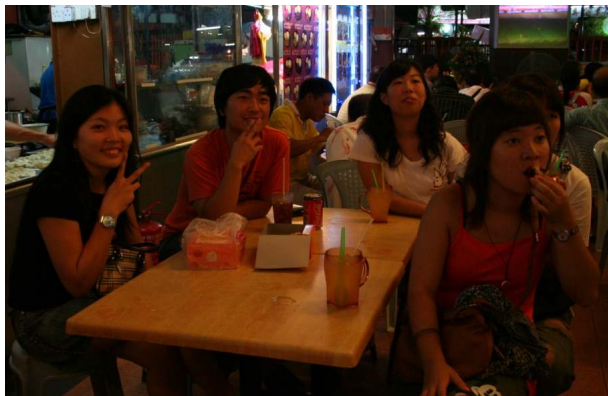
한국의 16강을 함께 응원하다.