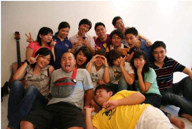
Youth와의 첫 외식