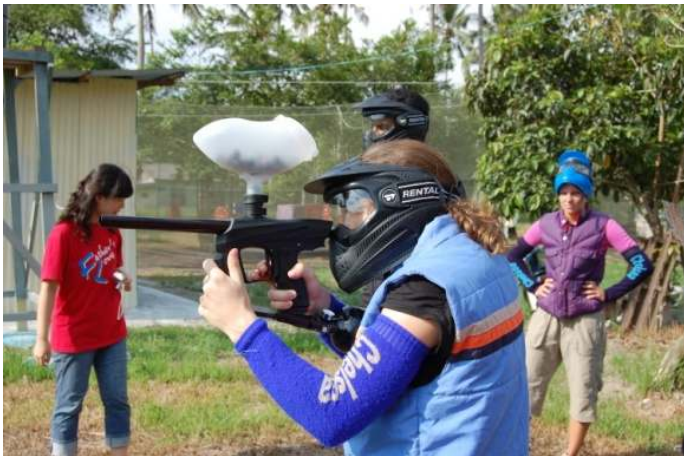
베다니홈 봉사자들과 함께한 페인트 볼 게임!