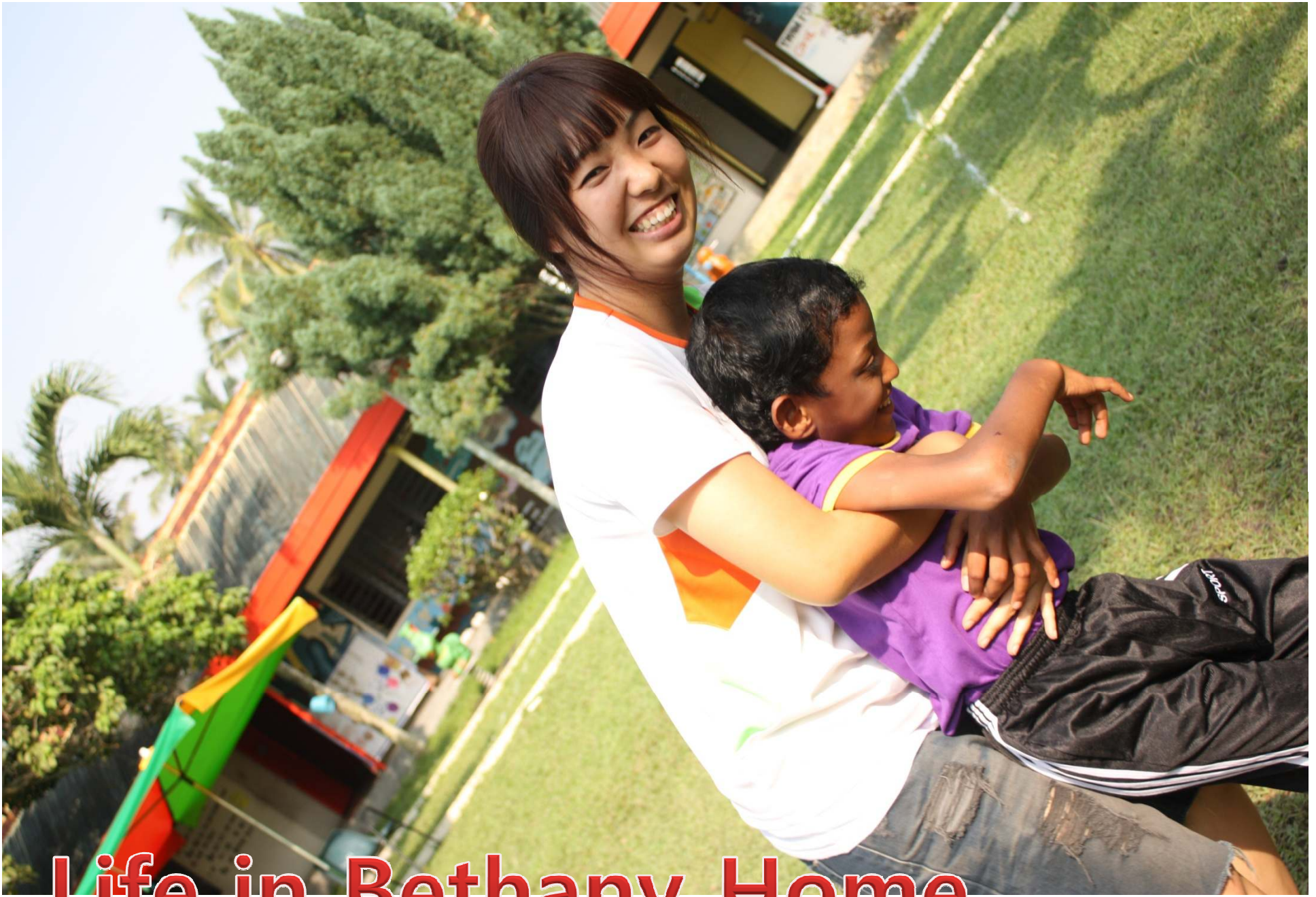
Life in Bethany Home